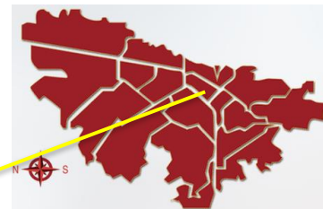
Localidad Mártires Bogotá D.C.